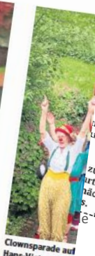
Clownsparade auf Hans-Victor-Haus